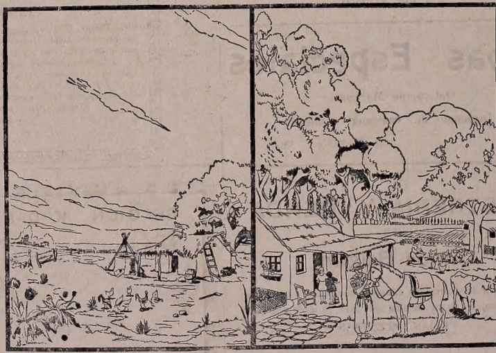
AQUI NO LLEGA LA REVISTA "LA CHACRA"

todo cambia y también la vida del trabajador rural